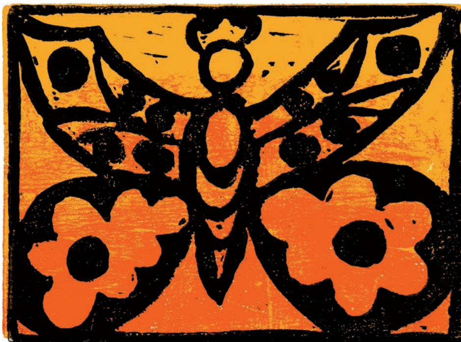
Schwarzlinienschnitt gedruckt auf Farbverlauf