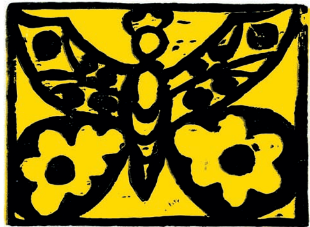
Schwarzlinienschnitt auf mit mittelgelb bedrucktem Hintergrund